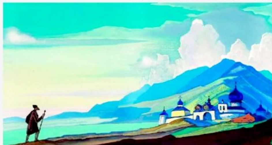
Н.К.Рерих. Странник Светлого Града. 1933 г.