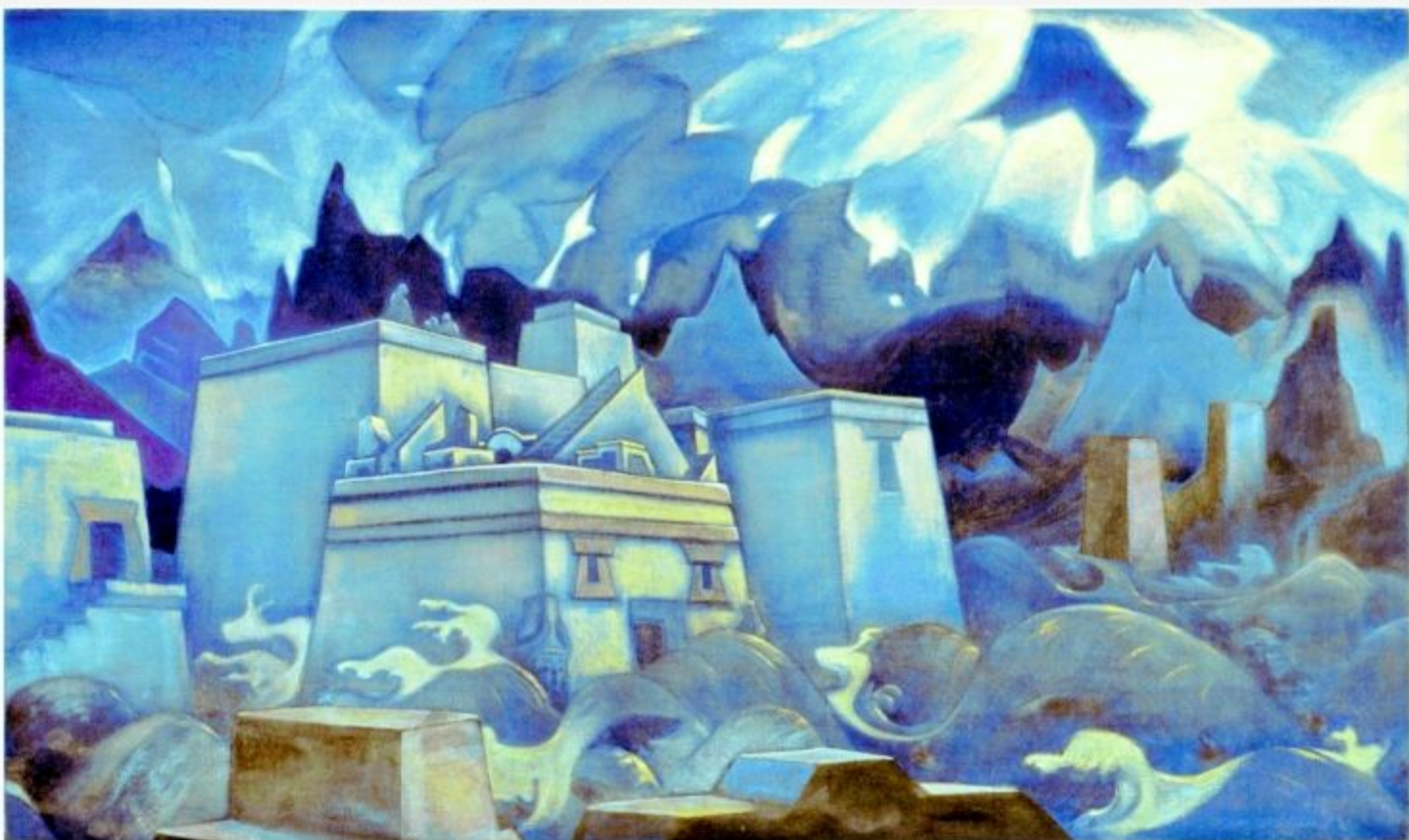
Н.К.Рерих. Гибель Атлантиды. 1929 г.