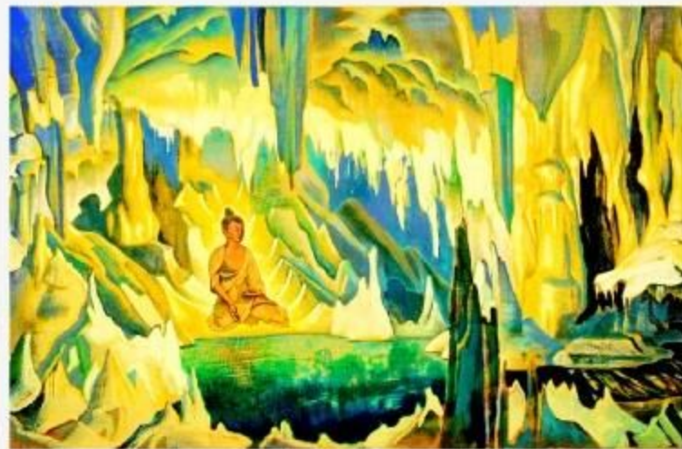
Н.К.Рерих. Будда Победитель. 1925 г.