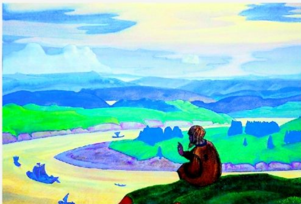
Н.К.Рерих. Прокопий Праведный за неведомых плавающих молится. 1914 г.