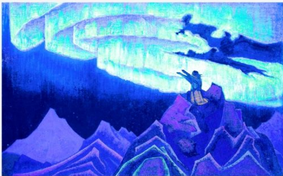
Н.К.Рерих. Моисей водитель. 1925 г.