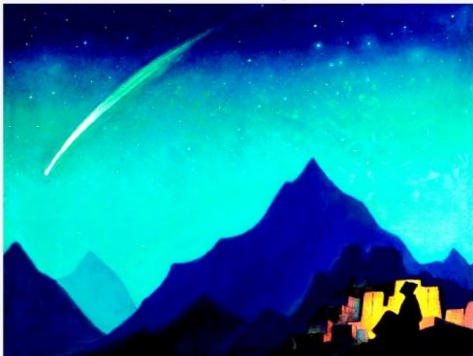
Н.К. Рерих. ЗВЕЗДА ГЕРОЯ. 1932 г.